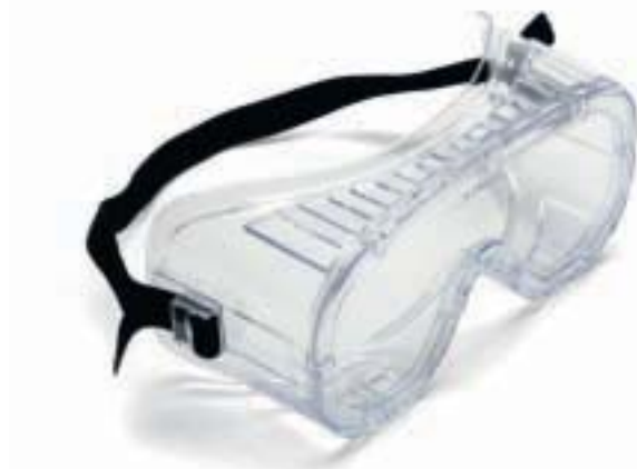
MONTATURA EN 166 34F CE LENTI U1 FN CE