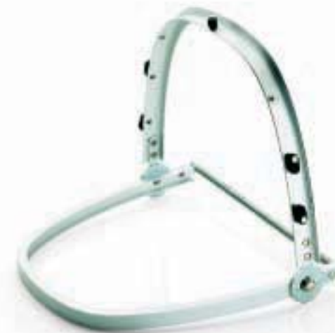
MONTATURA EN 166 39BT 0068 CE