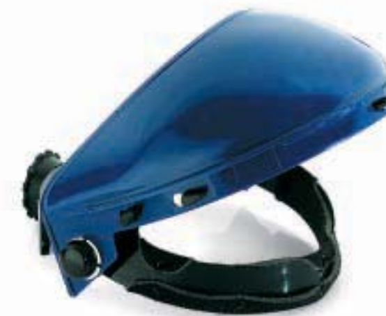
MONTATURA EN 166 389 BT 0068 CE