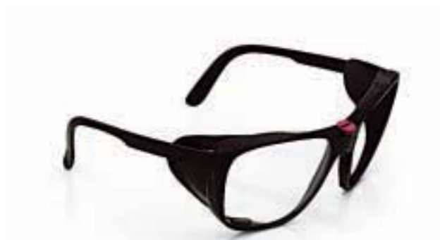
MONTATURA EN 166 FT CE LENTI ART. 566 U1S CE LENTI ART. 566P 2C-1.2 U1 FT K CE