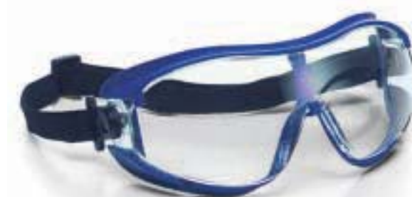
MONTATURA EN 166 34FT CE LENTI 2C-1.2 U1 FTKN CE