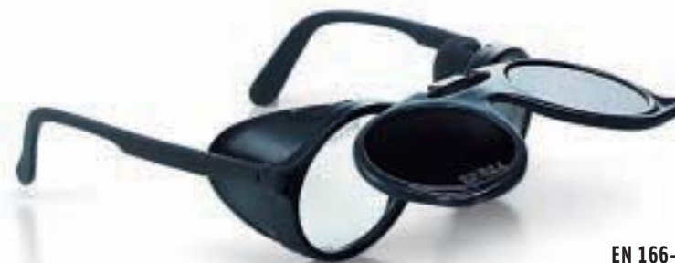
MONTATURA EN 166-175 FT CE LENTI 5XTW CE