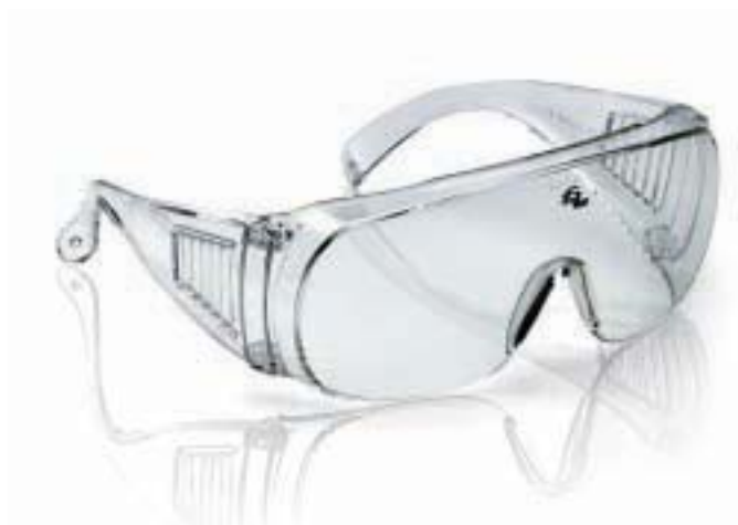
MONTATURA EN 166 F CE LENTI 2-1.2 U1 F CE