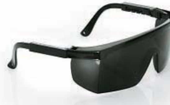
MONTATURA EN 175 F CE LENTI 3 U 1 F CE, 5 U 1 F CE