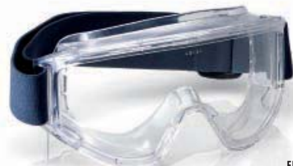
MONTATURA EN 166 349BT 2-1.2 0068 CE LENTI 2-1.2 U1BT9KN 0068 CE