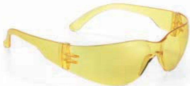
MONTATURA EN 166 FT CE LENTI 2C-1.2/5-1.1 FT CE