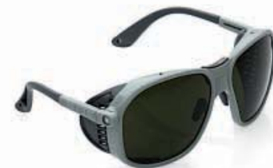
MONTATURA EN 175 F CE LENTI ART. 61501.3 3 U 2 F CE LENTI ART. 61501.5 5 U 1 F CE