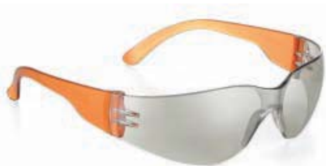
MONTATURA EN 166 FT LENTI 2C-1.7/5-1.7 U1 FT CE