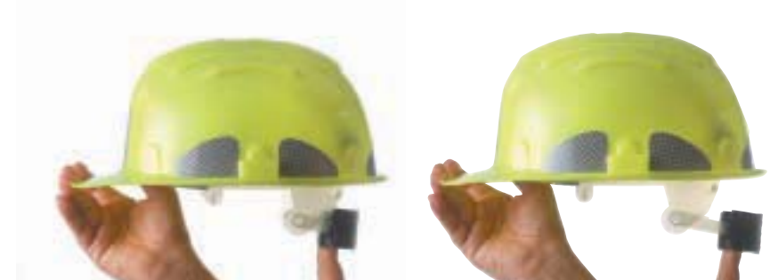
REGOLAZIONE CINTURINO ELASTICO